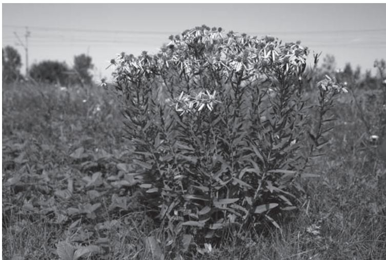
Obr. 2. Ozdobným druhom slabo zasolených pôd je hviezdovec bodkovaný ( Galatella punctata ) (lokalita Strážne, 2005).

deetum hystricis ), periodicky zaplavovaných depresí ( Plantagini tenuiflorae-Pholiuretum pannonicum ) a slaných trávnikov ( Puccinellietum limosae ). Zväz Festucion pseudovinae zahŕňa už porasty slaných stepí.