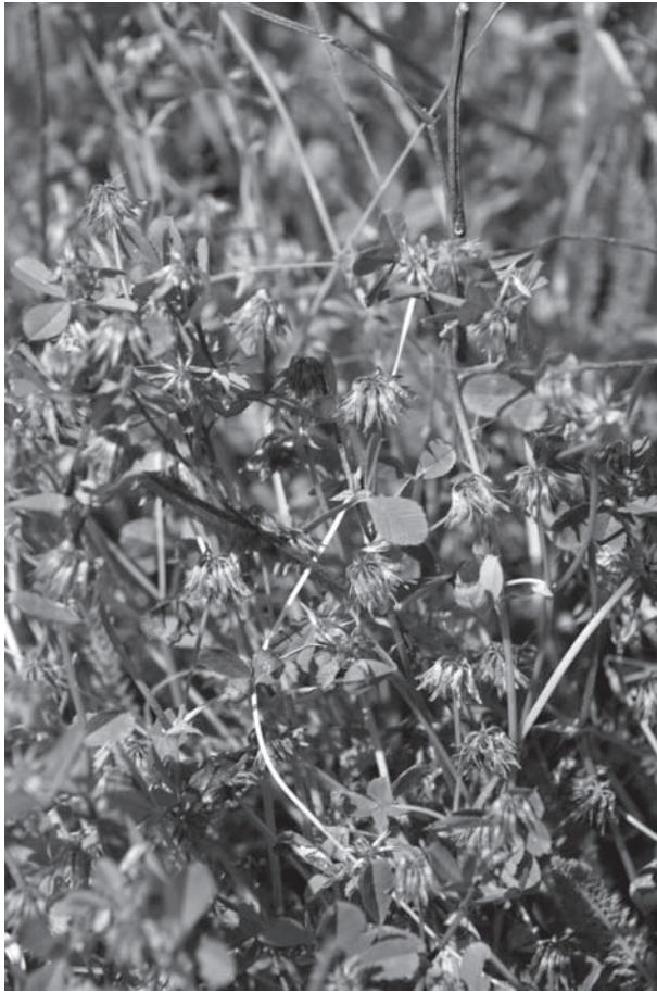
Obr. 3. Po viac ako dvadsiatich rokoch sa podarilo na Slovensku opätovne potvrdiť výskyt ďateliny hranatej ( Trifolium angulatum ); populácia rastie na ploche iba niekoľko málo štvorcových metrov (Národná prírodná rezervácia Kamenínske slanisko, 2010).

Medzi najviac ohrozené rastlinné druhy, viazané svojím výskytom na tento biotop, patria: palina slanmilná rozložitá ( Artemisia santonicum subsp. patens , kategória v červenom zozname Feráková a kol., 2001 – EN), loboda pobrežná ( Atriplex littoralis – CR), pre rastlík najtenší ( Bupleurum tenuissimum – EN), gáfvovka ročná ( Camphorosma annua – CR), ostrica delená ( Carex divisa – CR), pichliač úzkolistý ( Cirsium brachycephalum , endemit a anexový druh – EN), hviezdovec sivý ( Galatella cana , iba jedna známa lokalita na Slovensku – CR), hviezdovec bodkovaný ( Galatella punctata – CR, obr. 2), sivuľka prímorská ( Glaux maritima , v tomto biotope v súčasnosti na Slovensku nezaznamenaná – EN), bahienka psiarkovitá ( Heleochoa alopecuroides , v tomto biotope v súčasnosti na Slovensku nezaznamenaná